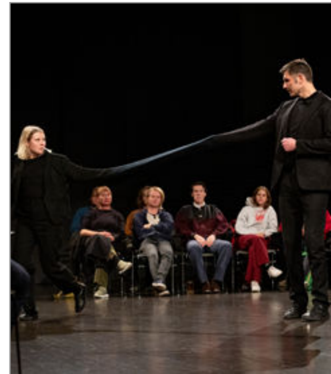
Danse staur, danse staur