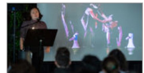
The DEN pitch