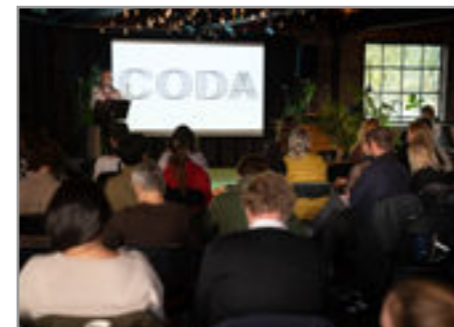
The DEN pitch